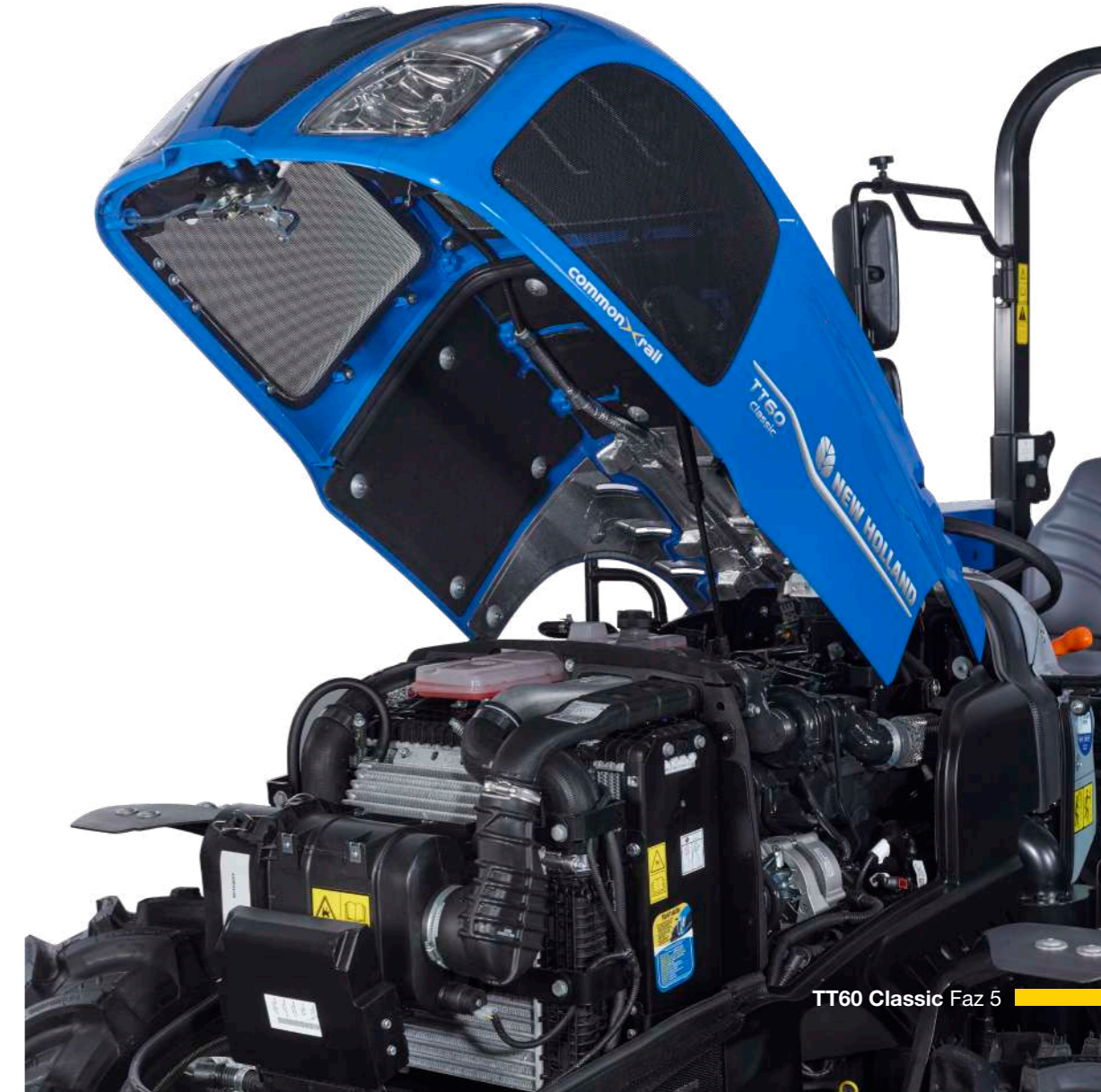
TT60 Classic Faz 5