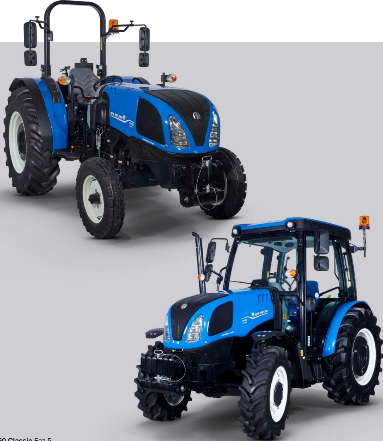
TT60 Classic Faz 5

Yeni New Holland TT60 Classic; yenilenen tasarımı, daha güçlü ve çevreci motoruyla, çiftçilerimiz tarafından en çok tercih edilen serilerden biri olan TT serisine eklenmiştir. Yerli S8000 motoru, 55 HP motor gücü ve 258 Nm maksimum tork değeri ile öne çıkan TT60 Classic serisi; çift çeker ve tek çeker seçeneklerinin yanı sıra, kabinli ve roplu alternatifleriyle de çiftçilerimizin beğenisine sunulmaktadır.